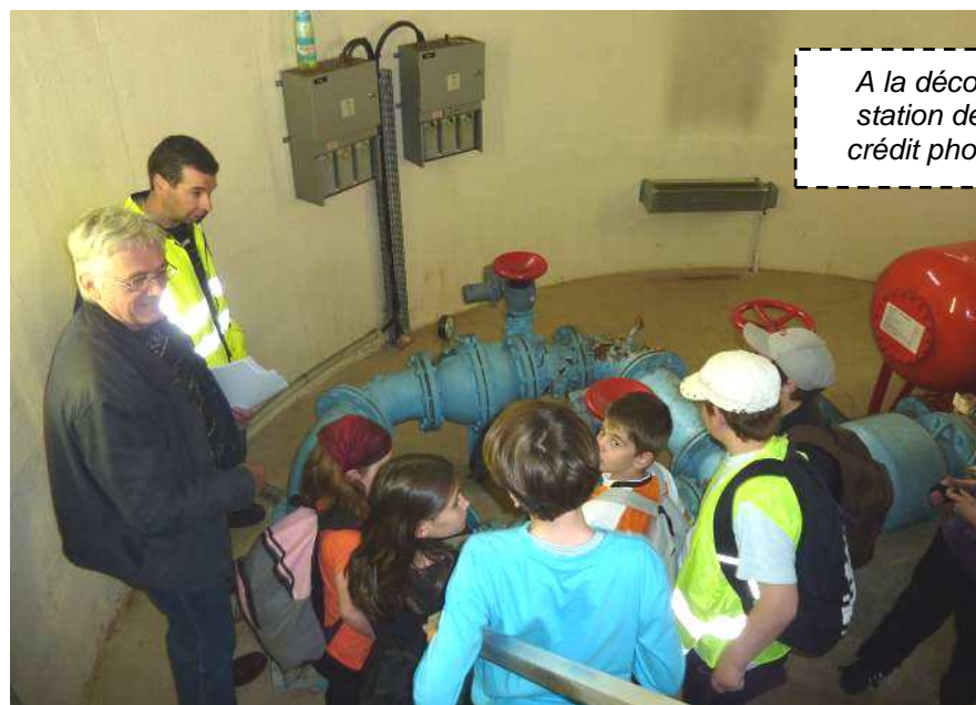
A la découverte d'une station de pompage

Courriel pierre.baderou@ac-strasbourg.fr - Tél : 03 89 49 11 33 ou 06 21 72 61 47