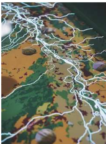
Exposition sur la nappe phréatique