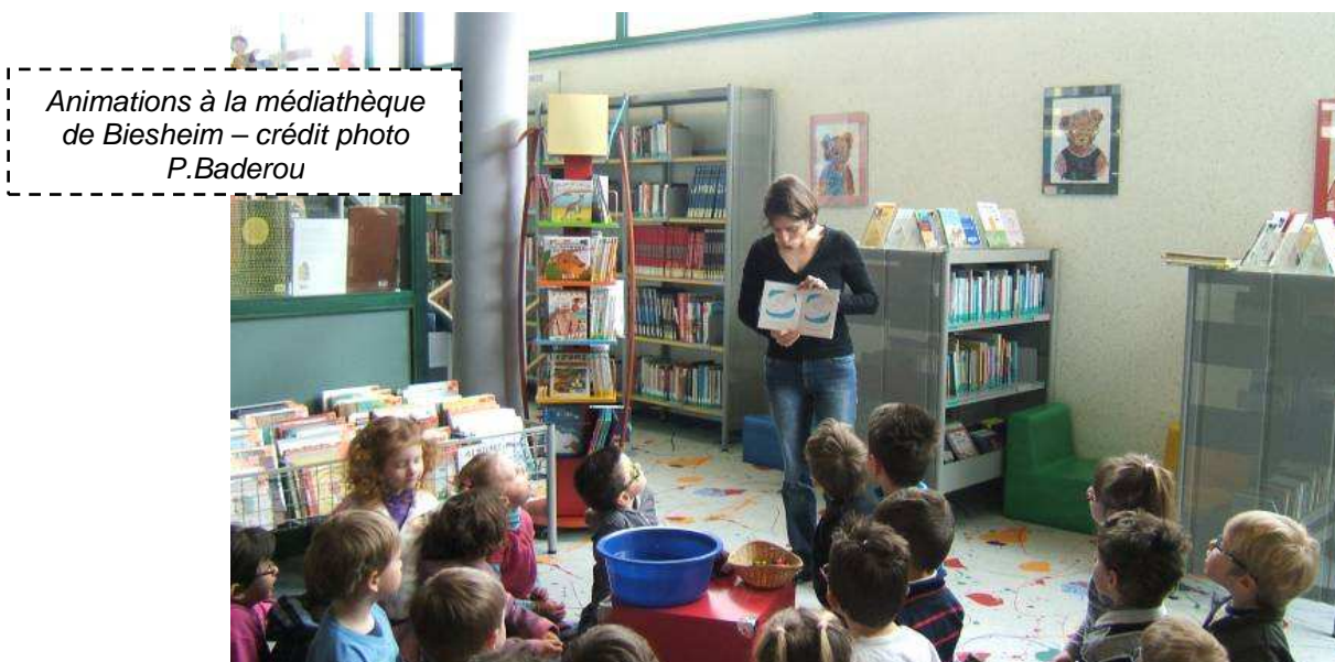
Animations à la médiathèque de Biesheim